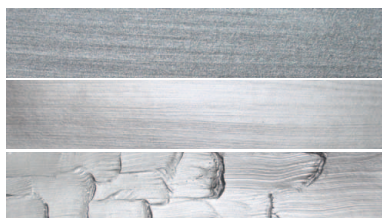
197 Brilliant Silver PW20/PW6 PBk7