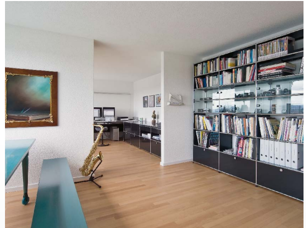
Atelier de graphique «Kraft Visual», Fällanden (Suisse)

Mira Brand, Technicienne Couleurs/Arts appliqués & magasin spécialisé en matériaux de construction